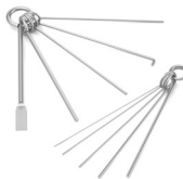
Aste per la pulizia delle punte ..... 1 unità Rif. CL5970