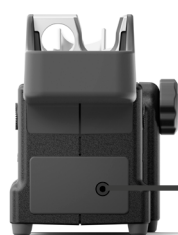
JTS JTT ヒータホース セット用スタンド